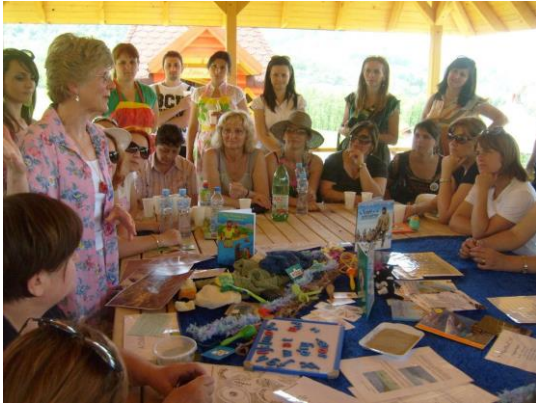
Презентација примера добре праксе из Велике Британије